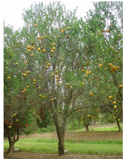
Mandarine de saison, variété Ponkan,