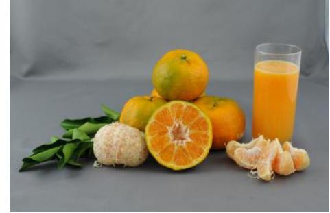
Mandarine de saison, variété Ponkan