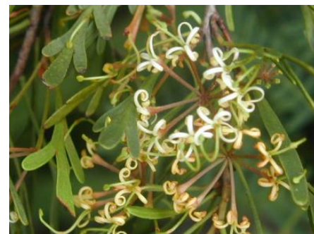
Fleur ouverte de Stenocarpus milnei