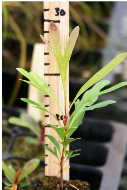
Jeune plant de Stenocarpus milnei en pépinière

Au stade jeune plant, les feuilles ont des formes très variables. Stenocarpus milnei peut être confondue avec Stenocarpus umbelliferus .