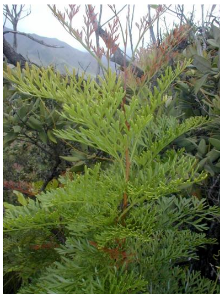
Rameaux de Stenocarpus milnei