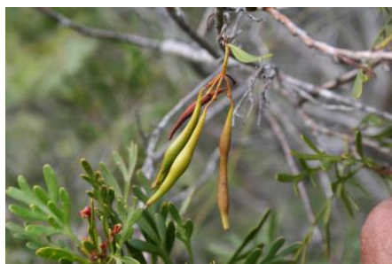
Fruits verts de Stenocarpus milnei