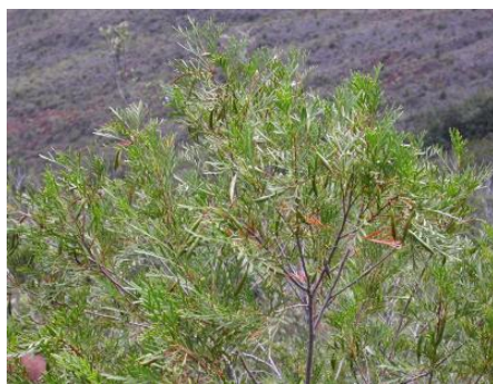
Stenocarpus milnei