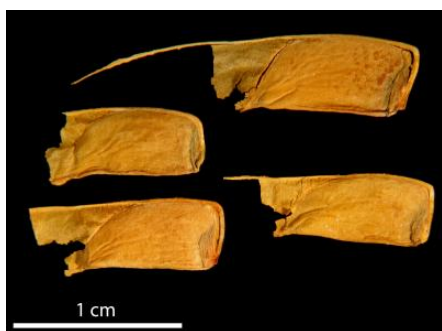
Graines de Stenocarpus milnei